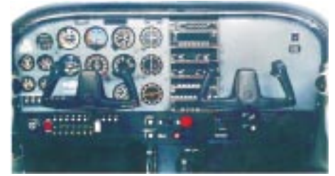
Das Original-Cockpit einer Cessna 172